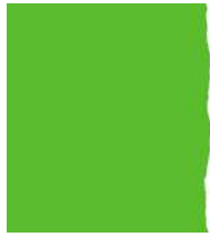
Klarenssee im Alten Park am 04.07.22 (unten) und 10.08.22 (rechts)